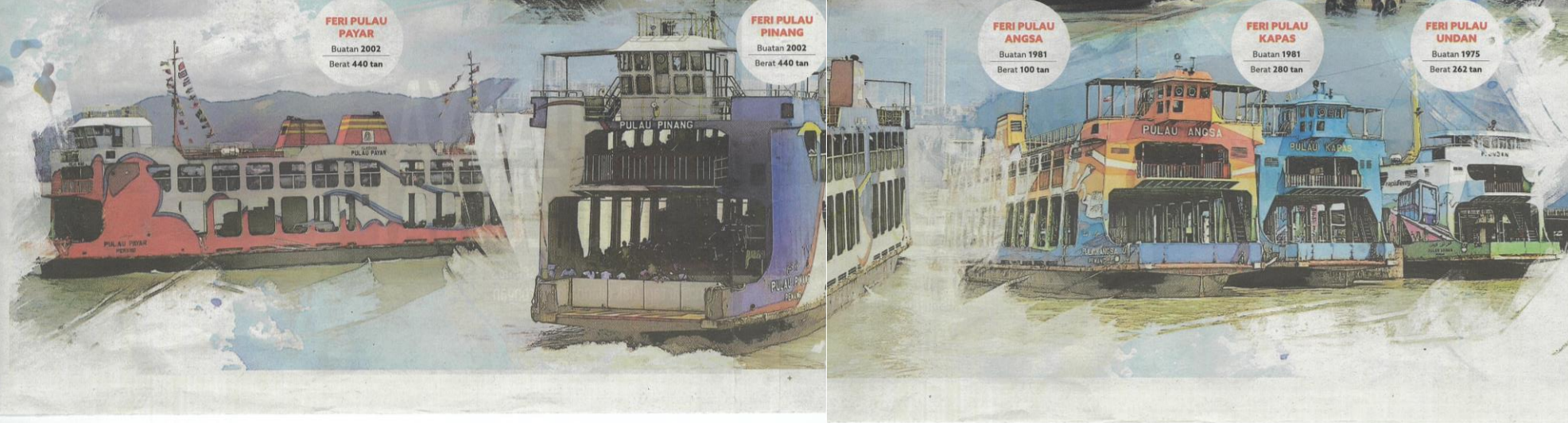
FERI PULAU UNDAK Buatan 1975 Berat 262 tan